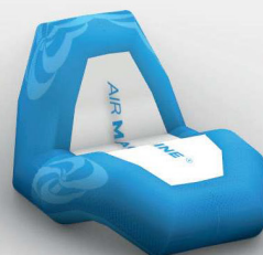
Fauteuil: 100x110 cm