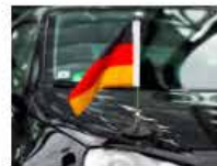
Drapeau de voiture