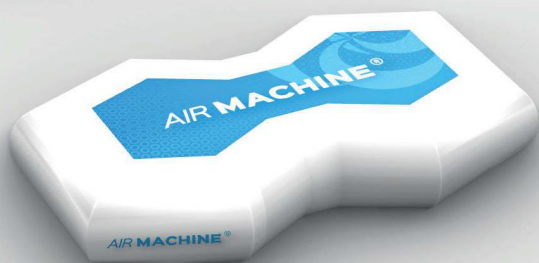
Siège 160x100 cm