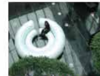
Circle of friends