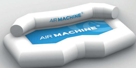
Canapé 2-places: 160x100 cm