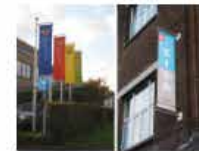
Bannière de façade et de mât