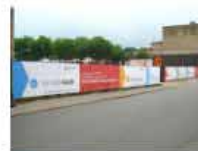
Bâche pour barrière Heras