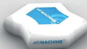
Pouf: diamètre 85 cm