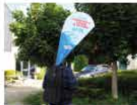
Beachflag Sac à dos