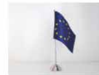
Drapeaux de table