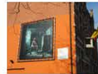
Cadre avec bache tendue