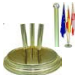
DIPLO gold 3 poles