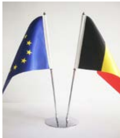
DRAPEAU DE TABLE DOUBLE FACE Jumeau

Mât 30 cm Mât et base de couleur argentée Drapeau: 10 x 15 cm