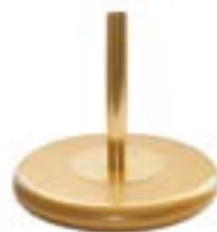
Standard gold 1 pole