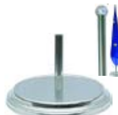
DIPLO silver 1 pole