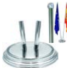
DIPLO silver 2 poles