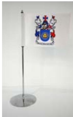
DRAPEAU DE TABLE STANDUP

Mât 30 cm Mât et base de couleur argentée Drapeau: 22,5 x 15 cm