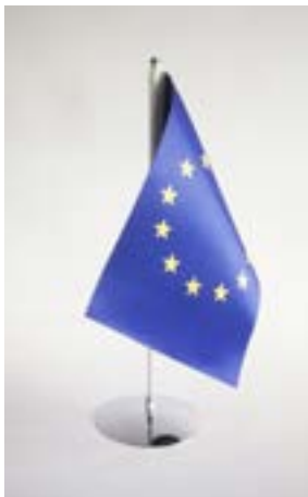
DRAPEAU DE TABLE DOUBLE FACE

Mât 42 cm Mât et base de couleur argentée Drapeau: 25 x 15 cm