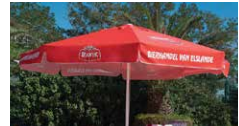
Parasol Mega rond Ø 300 cm