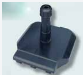
Pied en béton avec roulettes 30 kg