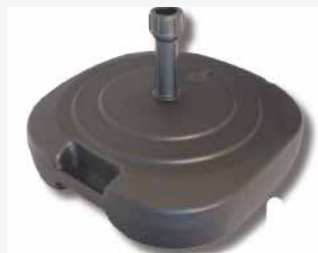
Pied à remplir 25 l