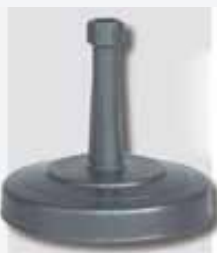
Pied en béton 30 kg