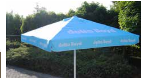
Parasol Mega carré 300 cm x 300 cm