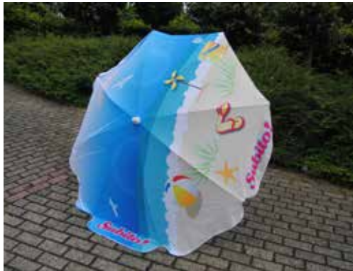
Modèle rond Ø 180 cm Ø 200 cm