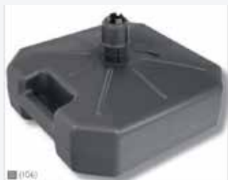
Pied à remplir 17 l