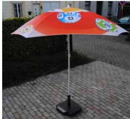
Modèle carré Ø 200 cm