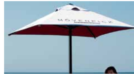
Parasol Medium carré 200 cm x 200 cm