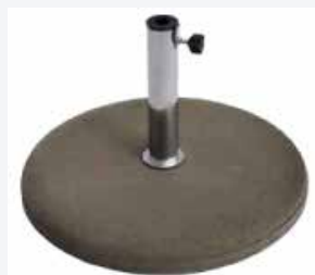
Pied en béton 60 kg Pour Medium et Mega Parasol