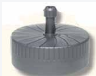
Pied à remplir 30 l