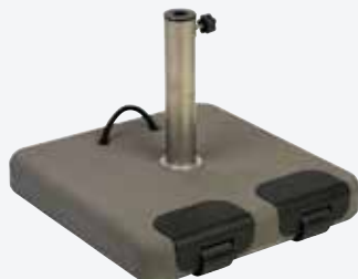
Pied en béton avec roulettes 45 kg Pour Medium et Mega Parasol